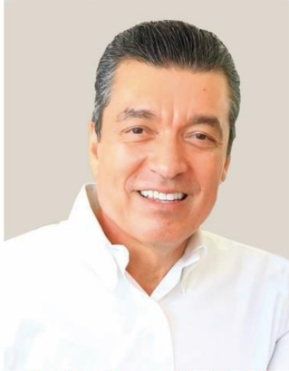
Dr. Rutilio Escandón Cadenas Gobernador Constitucional del Estado de Chiapas